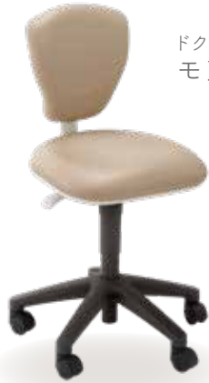
ドクターズツール モア Nr