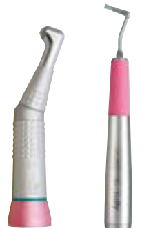
プロフイーコントラ ハンドピース 8MIIA