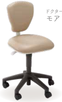
ドクターズツール モア Nr