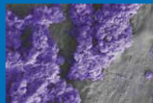
患者接触面から回収した DSB の SEM 画像 (倍率 10,000 倍)

バイオフィルムは、従来の湿潤面だけでなく、乾燥面でも増殖することが、近年の研究により発見されました。乾燥した表面のバイオフィルム (DSB) は、塩素などの殺生物剤に著しく抵抗し、オートクレーブなどの熱処理にも抵抗することが実証され、カーテン、ベッドレール、椅子、電話、カルテなど、医療現場のほとんどの表面に存在し、医療関連感染 (HAIs) に大きな影響を及ぼす可能性があると考えられています。