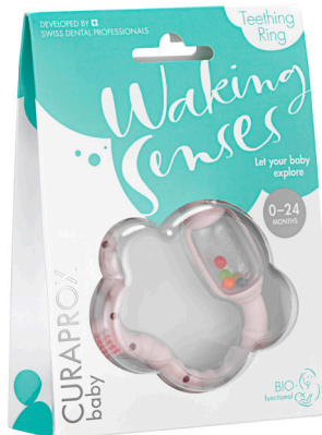
クラブロックスベビー 歯がため ピンク