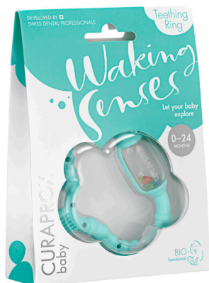
クラブロックスベビー 歯がため グリーン