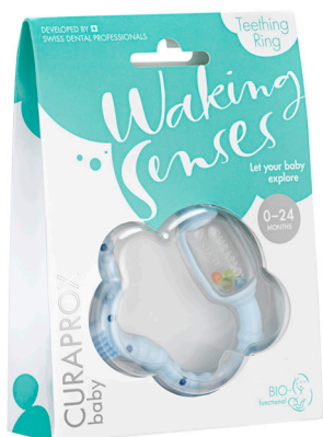
クラブロックスベビー 歯がため ブルー