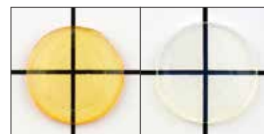
比較用試作品 クリアー ペレット(硬化直後)厚み: 1.0mm

高いコーティング硬度はそのまま、 黄色みの原因となる光重合開始材を極限まで減らしました。 Nu:leコート リキッド クリアーは硬化直後でも透明なため、重ね塗りしても歯科修復物本来の色調に影響しにくく、ホワイトニング対応シェードにも使いやすい設計です。