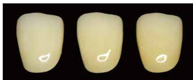
イーバ B2-GR ▶ Bプラスを1層塗布 ▶ Bプラスを2層塗布