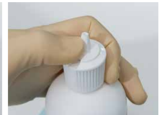
開閉とパウダー充填が片手で完了