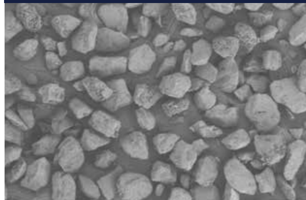
※SEM画像250倍 Fraunhofer IGB 研究所