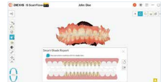
■ スマートシェードテクノロジー