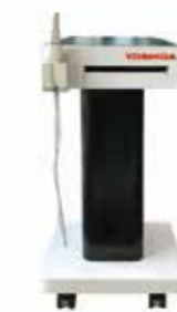
SC108 スキャンカート 標準価格 128,000 円