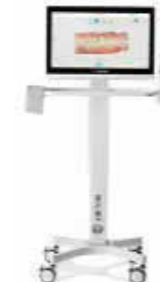
DEXIS スキャンカート 2023年発売予定