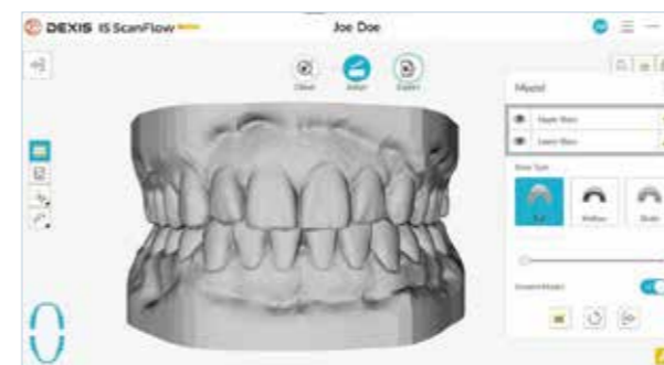
■ 3Dプリント用模型の作成