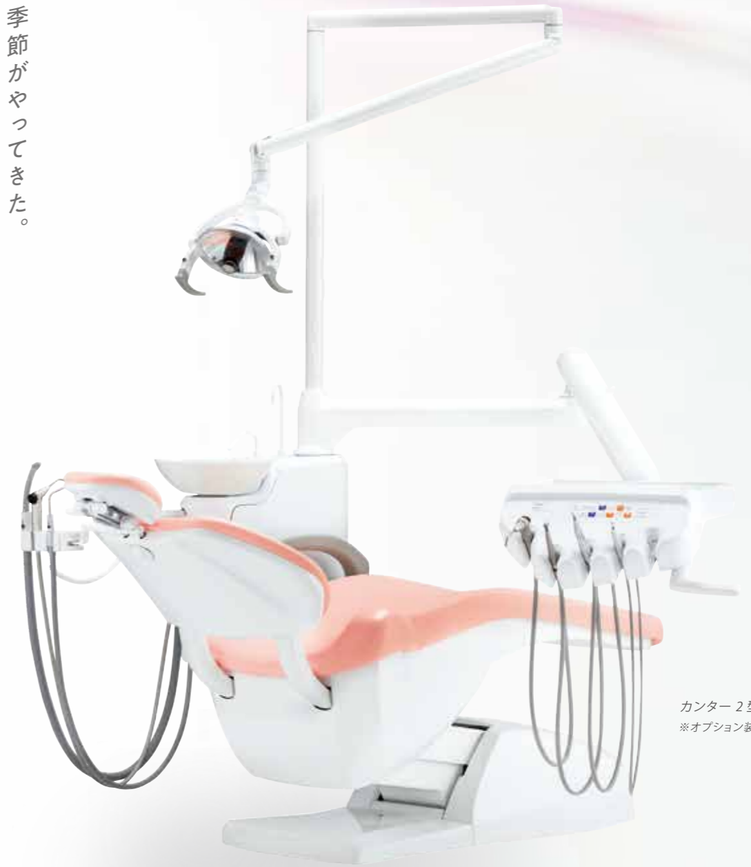
カンター 2 型 (オーバーアーム) ※オプション装着例です。