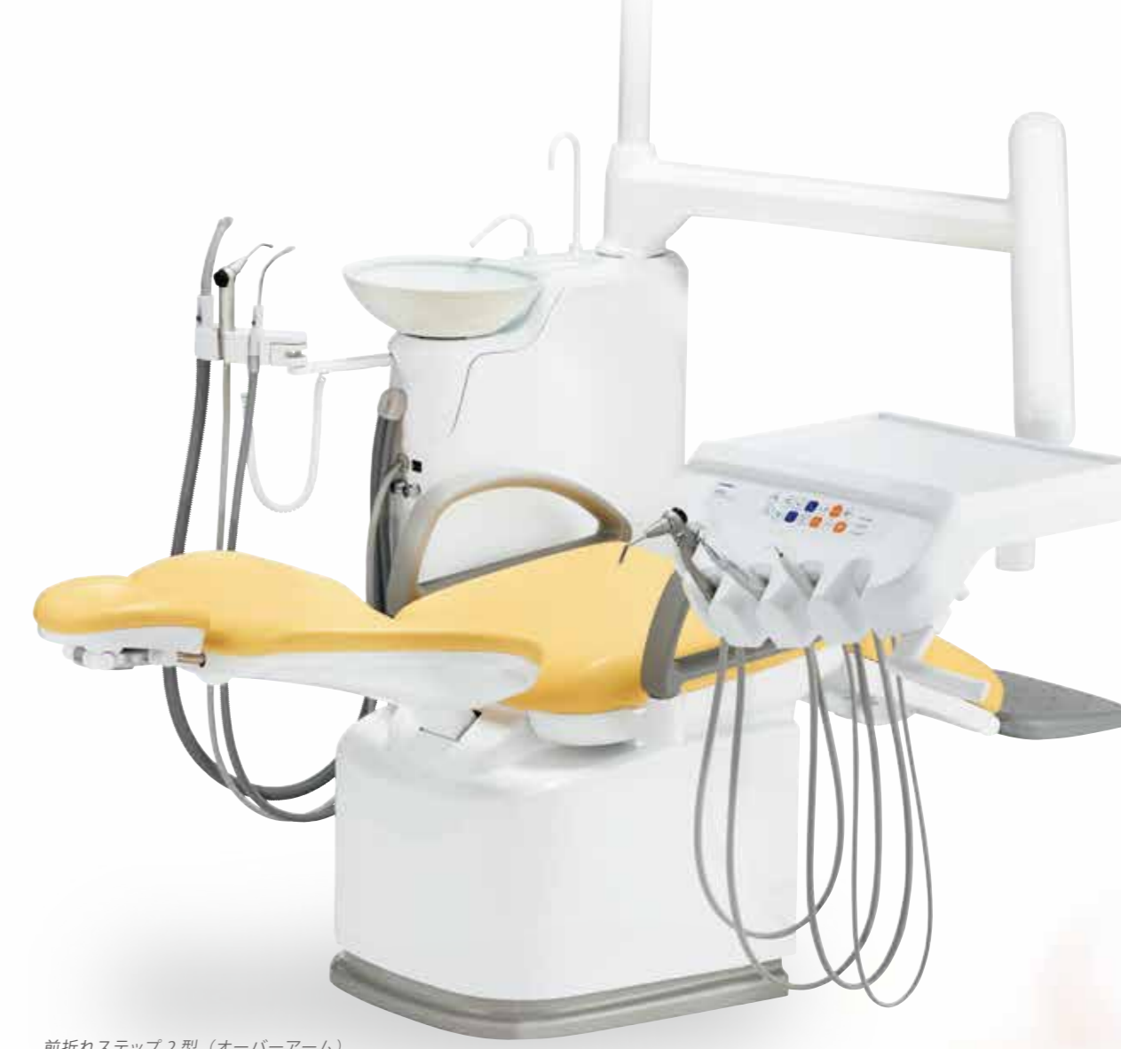
前折れステップ2型（オーバーアーム） ※オプション装着例です。

シンプルイズベストな仕様でコストパフォーマンスを 追求し誕生した「ノバ シーズンズα」。 オプション品も充実していますので、 先生の診療スタイルに合わせた仕様を実現します。