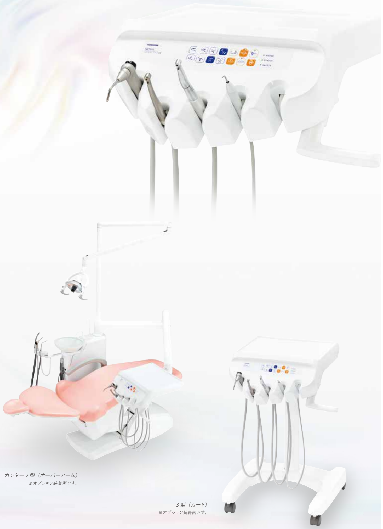
3 型 (カート) ※オプション装着例です。