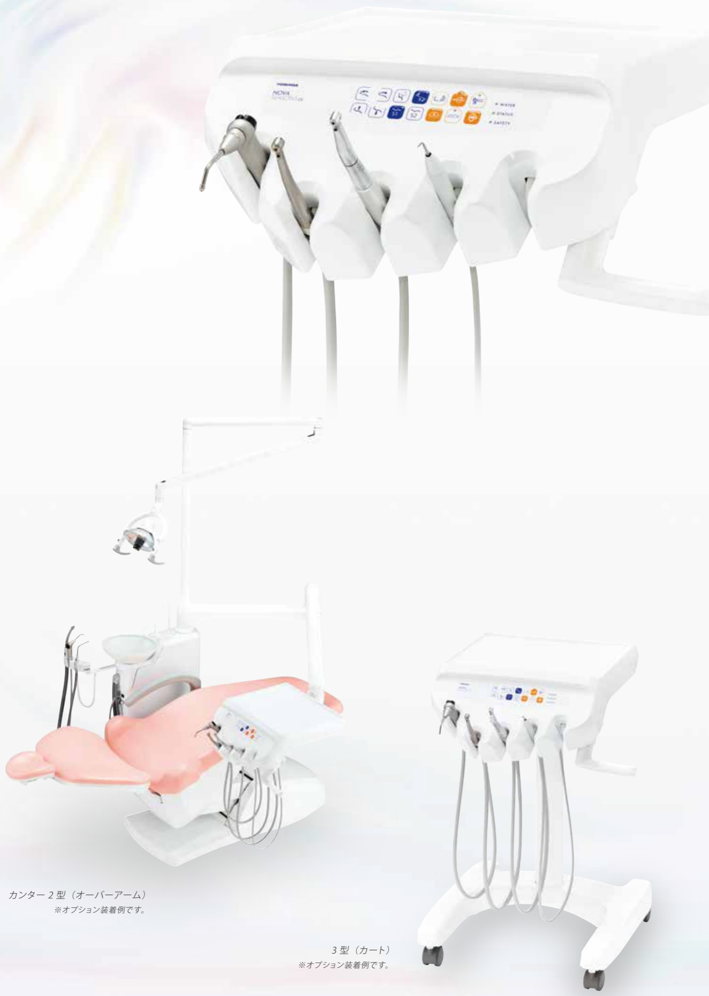
カウンター2型（オーバーアーム） ※オプション装着例です。