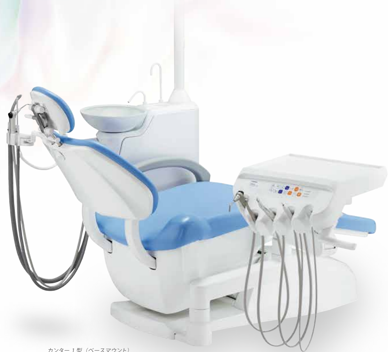
カウンター1型（ベースマウント） ※オプション装着例です。

明るく爽やかな診療空間創りを演出。 チェアとテーブルの組み合わせで、 計6つのバリエーションからお選びいただけます。