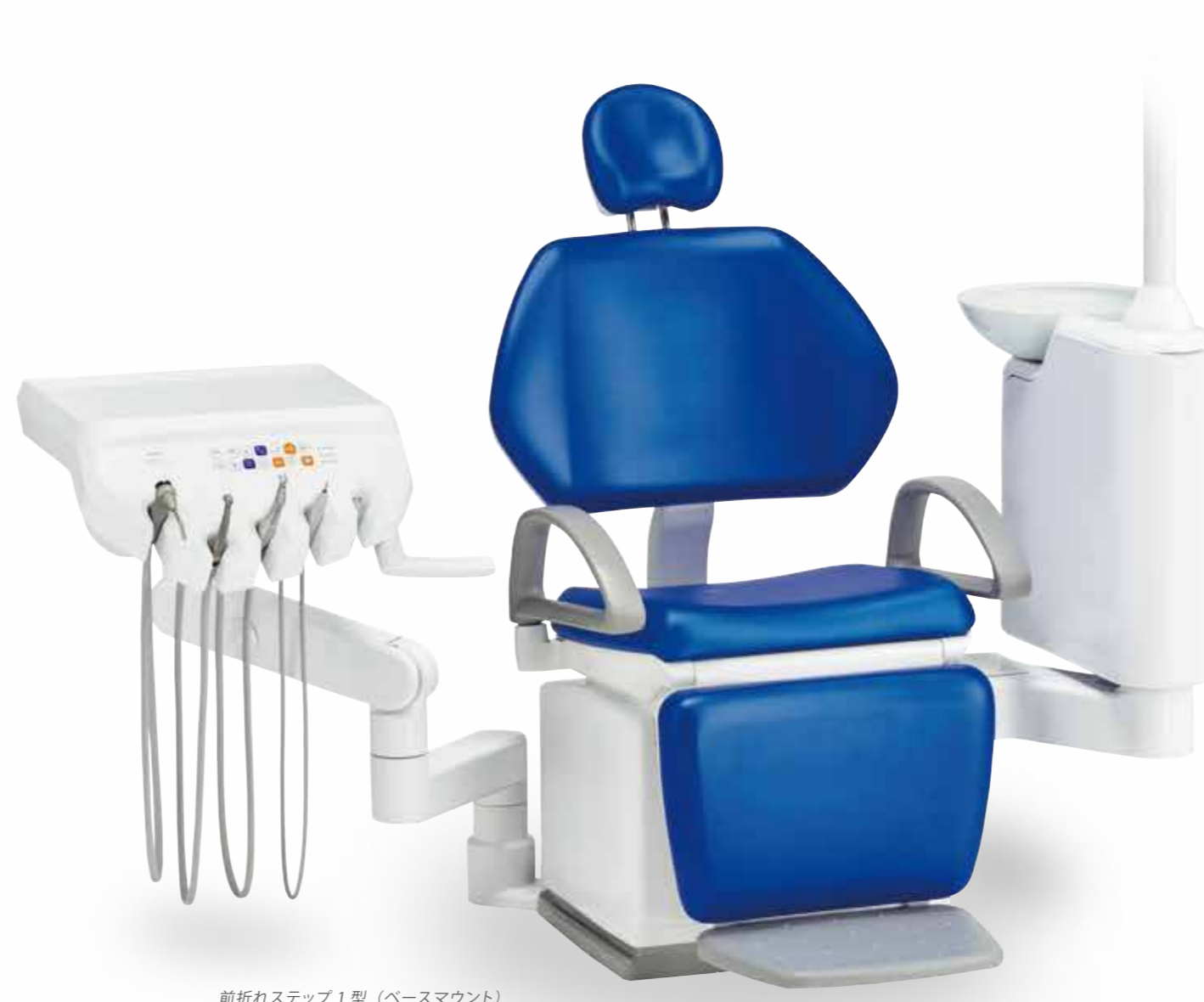
前折れステップ1型（ベースマウント） ※オプション装着例です。