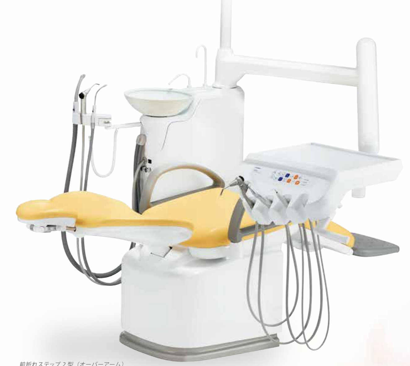
前折れステップ2型（オーバーアーム） ※オプション装着例です。

シンプルイズベストな仕様でコストパフォーマンスを 追求し誕生した「ノバ シーズンズα」。 オプション品も充実していますので、 先生の診療スタイルに合わせた仕様を実現します。