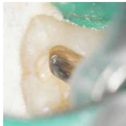
プレジジョン Endo Bur を用いて、根管口部に覆い被さっている象牙質を削合している。