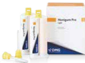
ハニガムプロ ライトボディ 50mL×2本 ハニガムプロファスト ライトボディ 50mL×2本 標準価格:各8,800円(税別)