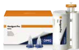
ハニガムプロ ヘビーボディ 380mL×1本 ハニガムプロファストヘビーボディ 380mL×1本 標準価格:各19,300円(税別)