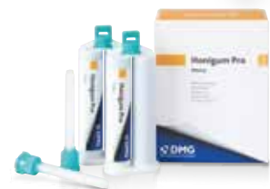
ハニガムプロ ヘビーボディ 50mL×2本 ハニガムプロファスト ヘビーボディ 50mL×2本 標準価格:各8,190円(税別)