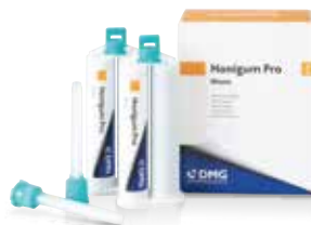
ハニガムプロ モノボディ 50mL×2本 ハニガムプロファスト モノボディ 50mL×2本 標準価格:各8,500円(税別)