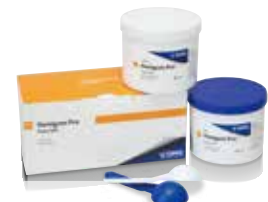
ハニガムプロ バテソフト ベース/キャタリスト 各450mL 標準価格:21,000円(税別)