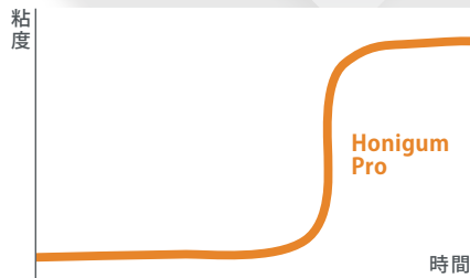
2分45秒間の作業時間(通常タイプ)

口腔内からの撤去時もマージン部がちぎれにくいため、精度の高い作業模型が作れます。