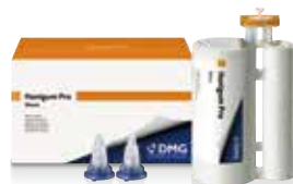
ハニガムプロ モノボディ 380mL×1本 ハニガムプロファストモノボディ 380mL×1本 標準価格:各16,000円(税別)