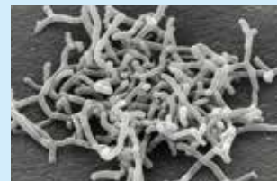
Bifidobacterium longum BB536 (ビフィドバクテリウム ロンガム BB536)

ビフィズス菌BB536は乳児から発見された “ヒト由来”のビフィズス菌です。 1969年に発見されて以来、世界中から多くの 生理機能が報告されています。