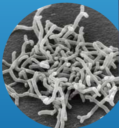
Bifidobacterium longum BB536 (ビフィドバクテリウム ロンガム BB536)