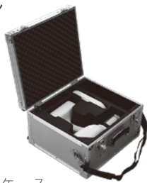
キャリングケース