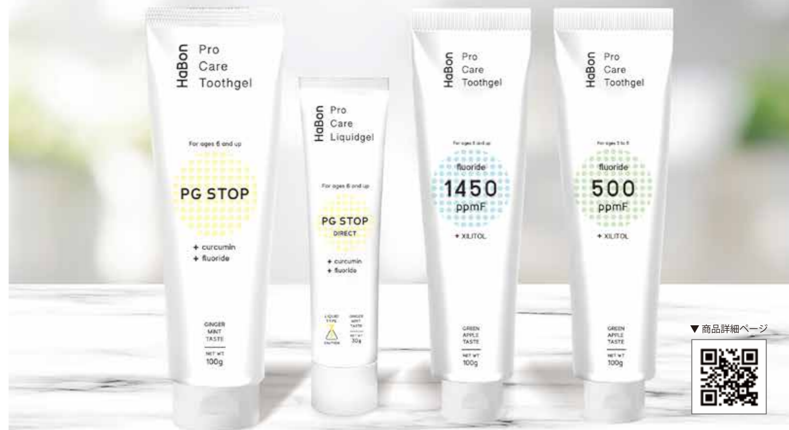
Pro Care ToothGel HaBon ラインナップ