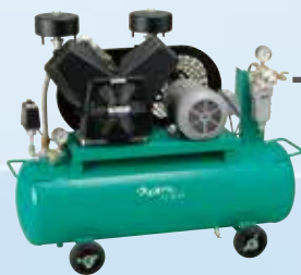
エアーコンプレッサー