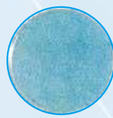
ろ過後 1個以下の菌