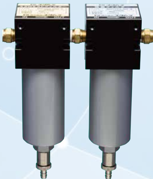
マイクロミストフィルター 除菌フィルター