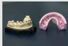
コルテン ラボパテで作製した模型を使用