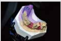
デスクトップスキャナーで模型をスキャン