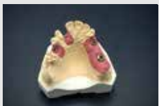
GI マスク 3Dで完成した模型