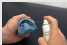
GI マスク分離材で印象を分離