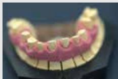
GI マスク 3Dで仕上がった模型