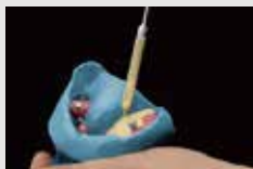
超硬石膏でインプレッションを付与する