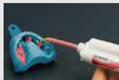
GI マスク 3Dを印象材に直接適用