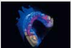
デスクトップスキャナーで模型をスキャン