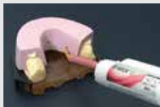
GI マスク 3Dを投入