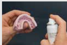
GI マスク分離材で印象を分離