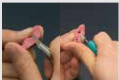
容易な切削とトリミング