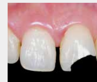
①左側前歯切端破折にて来院