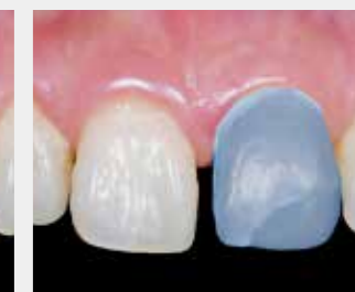
②フックスアップにてシミュレーションを行った後、印象採得