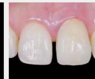
⑥セメントを用いて装着