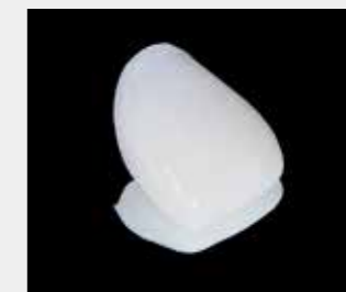
⑤1分45秒-2分20秒後、硬化を確認し、口腔内から取り外し、完全硬化後マージン出し、咬合調整、研磨を行う