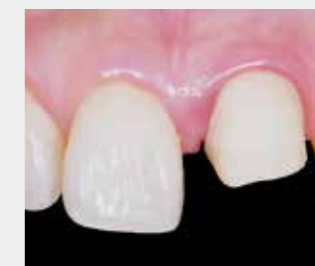
③支台歯形成を行う