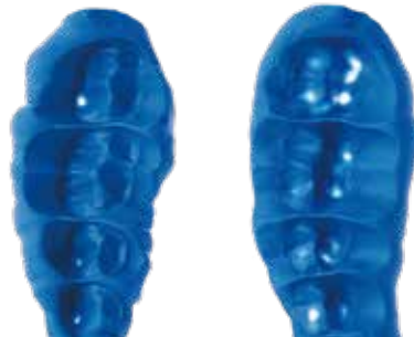
※イメージ 咬合接触面の状態変化を記録

咬合面の再現性が高く、収縮率-0.1%以下で寸法変化が維持できるアルティバイトは、採得したバイトの長期間の保管に向いています。咬合調整や矯正治療中の咬合状態の経過確認にもお勧めです。