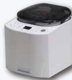
DC てきおん君 カートリッジ ホワイト