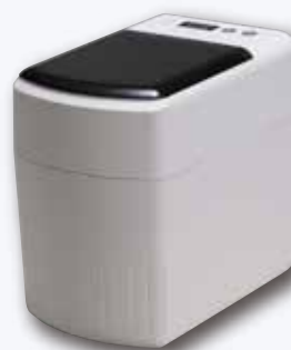
DC てきおん君 ホワイト

てきおん君ホワイト・てきおん君カートリッジホワイト共に、様々な寒天に対応できる6つのプログラムが予め記憶されています。フリープログラムは先生のお好みに応じて自由に設定いただけます。