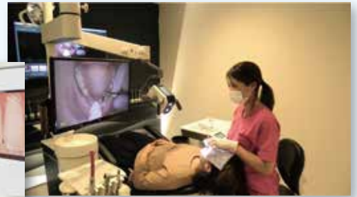
疲れのないポジションで正確な処置を提供。

ネクストビジョンの特設サイトから 撮影例やユーザーインタビューの動画 がご確認いただけます。