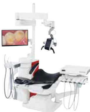
EXCEED Cs 「エクシード シェーズ」