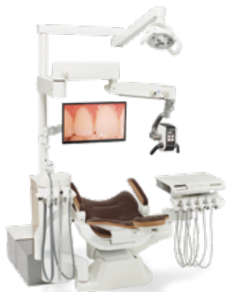
EXCEED Cs PREMIUM