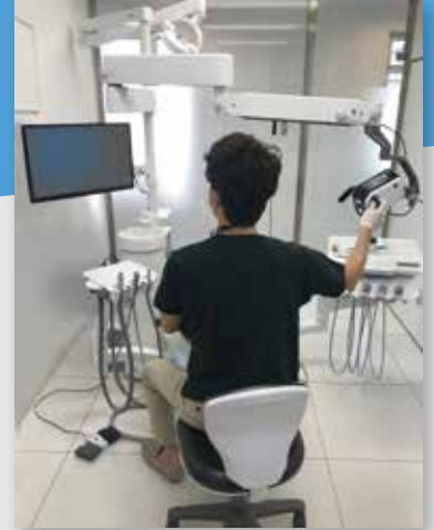
可動範囲が広く、無理のない姿勢で治療ができる。

省スペースなユニット一体型で、アシスタントの立ち位置を確保でき、足下もスッキリ。片手でもカンタンに位置づけできる軽量アームはさらに可動域が広くとれるようになります。