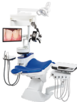
EXCEED CL 「エクシード シエル」