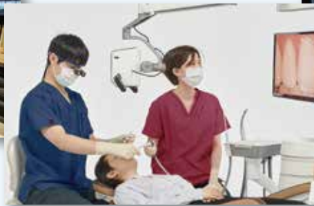
ゆとりあるスペースで、アシストしやすいユニットマウント。