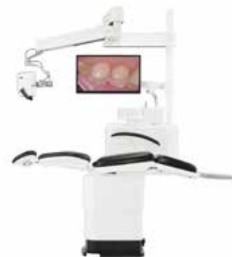
SERIO Mu R