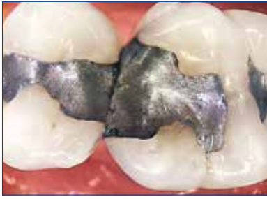
自動照度調整なので白歯部も明るく鮮明に撮影できます。