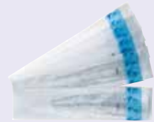
●レンズカバー(500枚入)