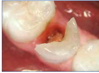
ピント自動調整なので隣接面カリエスなども簡単に撮影できます。