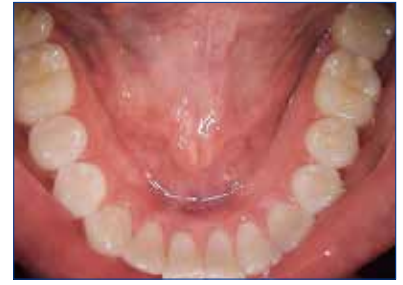
偏光プリズムレンズ搭載で光のハレーションを抑えます。