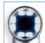
明るい部位撮影時

煩わしい調整を必要としないピント自動調整機構を搭載。撮影したい部位を的確に撮影します。8個のスーパー白色LEDは撮影に十分な明るさを提供。しかも撮影部位の照度に合わせて自動的に光量を調整します。