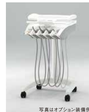
写真はオプション装備例