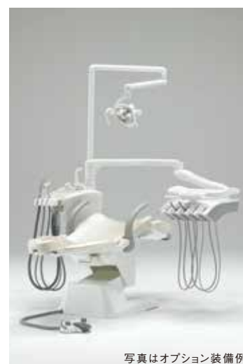
写真はオプション装備例