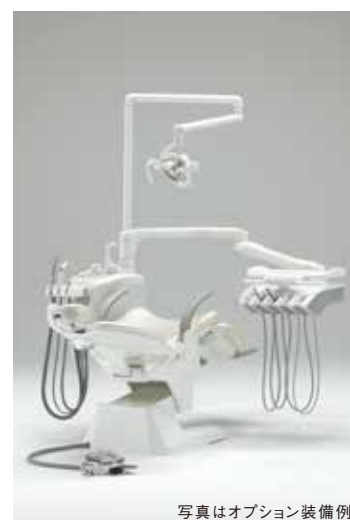
写真はオプション装備例