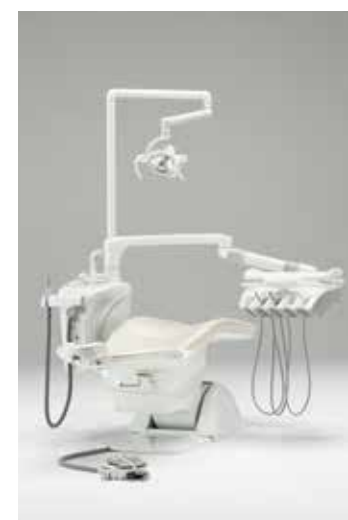
写真はオプション装備例