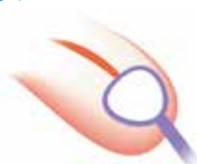
オーラルブラシ ペロリーナ