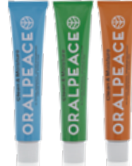
オーラルピース クリーン&モイスター