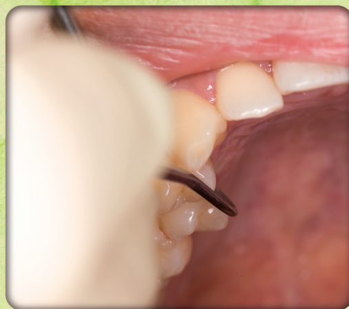
従来のシックルスケーラー