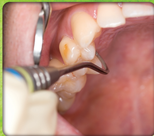
オフセットシックル N67