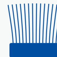
毛先の開いた歯ブラシ