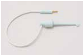
チャンネルインストゥルメントホルダー / 1本