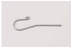
口角ホルダー / 1本