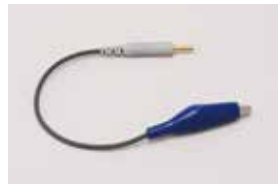
排唾管クリップ / 1本