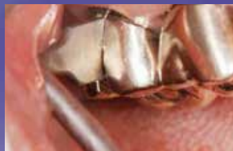
図3●クラウンリムーバーをさし込み、 スリットを開くように力をかける。