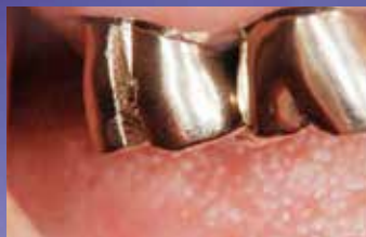
図2●クラウンカッター H34 にて 約1mm幅の切れ込みを入れる。