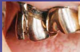
図4●この症例では1～2分でクラウ ン除去が行えた。