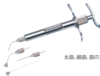
太曲、細曲、直の3種ニードル付

カートリッジタイプの印象材に使用するシリンジです。カートリッジの出し入れが容易で、操作しやすい設計です。