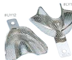
セット内容 6個入 #UY12,13,14 #LY 12,13,14

アルギン酸及びシリコン印象用トレー。日本人の顎に合わせて設計されています。特に歯肉類移行部が低く設計されているのが特長です。