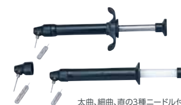
太曲、細曲、直の3種ニードル付

より密閉性を高めたシリンジです。材質には、耐熱性に優れたジュロコン樹脂を採用し、プランジャーはダブルパッキン(5/16"のみ)で空気・水分の混入を防ぎます。